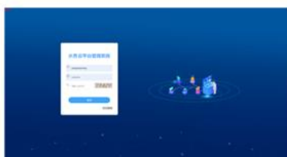
水务云客户管理系统