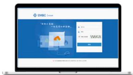
燃气云客户管理系统