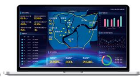
燃气云客户管理系统